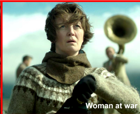
Woman at war