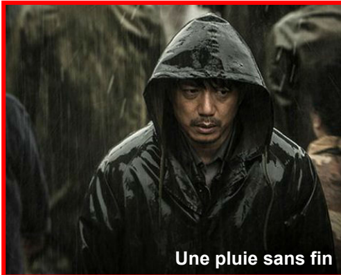
Une pluie sans fin

Et pour ceux qui en ont : Bonnes vacances !