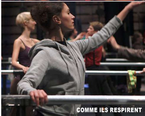
COMME ILS RESPIRENT