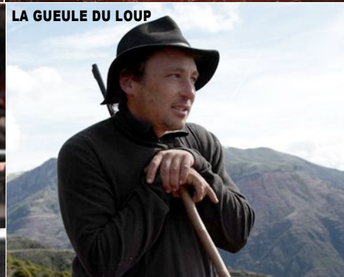
LA GUEULE DU LOUP