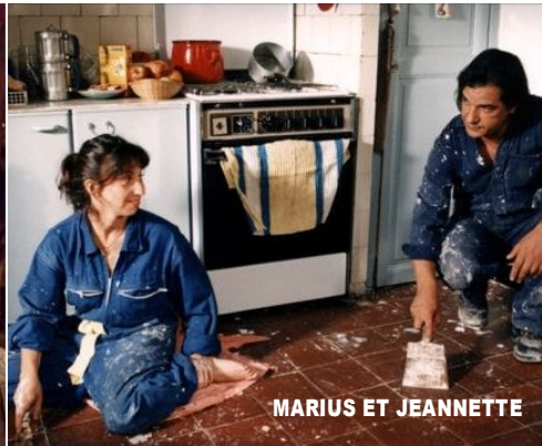
MARIUS ET JEANNETTE