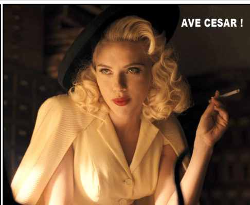
AVE CESAR !