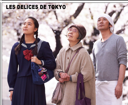
LES DELICES DE TOKYO