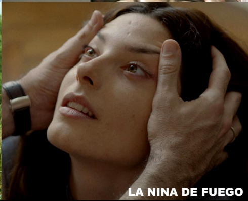
LA NINA DE FUEGO