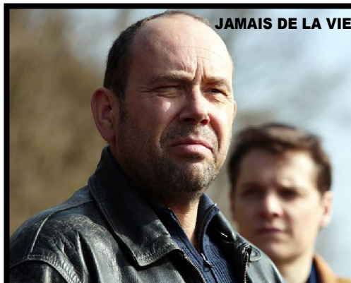
JAMAIS DE LA VIE

Et enfin, nouveau festival donc, PLAY IT AGAIN ! consacré aux films de patrimoine restaurés dans l'année. Nous avons choisi pour vous quatre œuvres pour le plaisir toujours renouvelé de les voir dans leur milieu naturel, la salle de cinéma. PLAY IT AGAIN ! Du 22 au 28 avril (détail page 4). Bon festival et bonnes toiles !