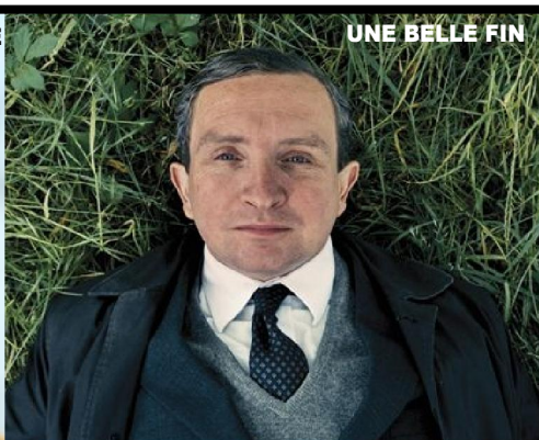
UNE BELLE FIN