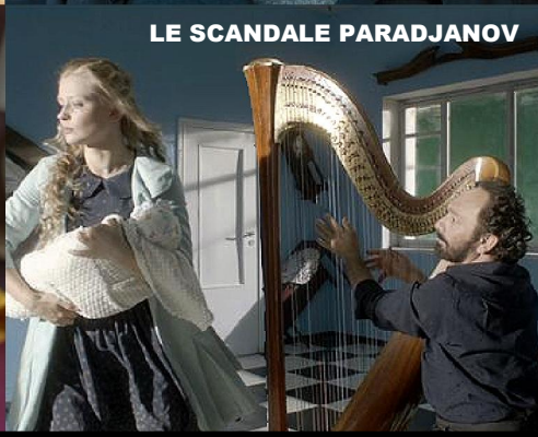
LE SCANDALE PARADJANOV