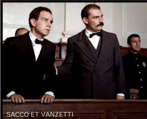
SACCO ET VANZETTI