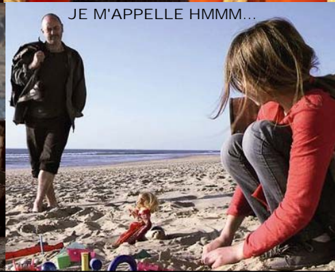
JE M'APPELLE HMMM...