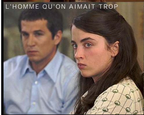
L'HOMME QU'ON AIMAIT TROP