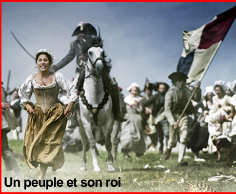
Un peuple et son roi