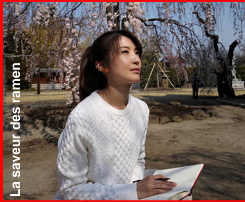
La saveur des ramen