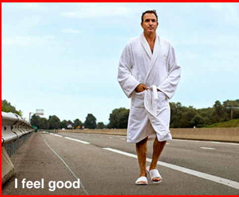
I feel good