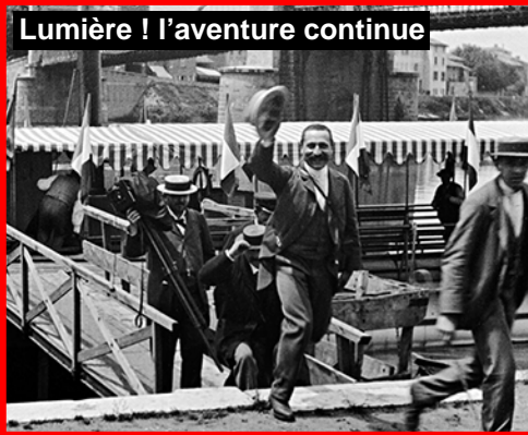
Lumière ! l'aventure continue