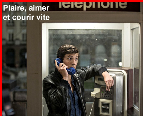
Plaire, aimer et courir vite