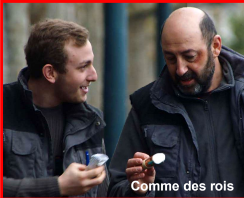
Comme des rois

Parmi les nombreuses leçons apprises durant cette dernière année (et dont certaines resteront in petto) l'une est que le prix du ticket cinéma n'est en aucune manière déterminant dans le choix du spectateur. Malgré des tarifs très compétitifs une partie conséquente du public, notamment la jeunesse, a boudé de manière soudaine ce cinéma qui séduisait pourtant depuis des générations. Désormais, l'enjeu majeur aux 400 Coups sera de le reconquérir et lui faire de vraies propositions alternatives pour bien sûr continuer ce travail de fond qui a fait de ce cinéma ouvert sans réelle conviction sur sa viabilité, en septembre 1991 – déjà l'autre siècle – un cinéma à part qui peut tout de même faire référence (au diable la modestie) dans le giron départemental voire régional. Le Roi (Rex) est mort, longue vie au cinéma Les 400 Coups !