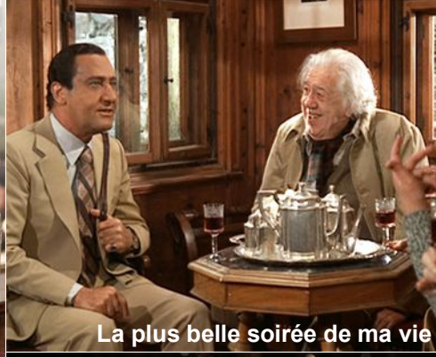
La plus belle soirée de ma vie